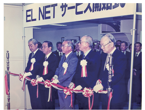
▲ELNET サービス開始式の様子

東京本社で働く従業員46名のうち、男女比率は 男性6割、女性4割 となっている。管理職は12名で、男性9名、女性3名が活躍中。また、従業員の 平均年齢は44・2歳 で、年齢バランスを考慮に入れた定期採用を続けている。